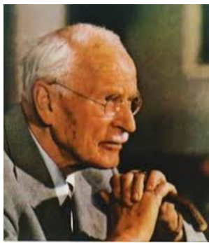
ユング Carl Gustav Jung 1875年 - 1961年