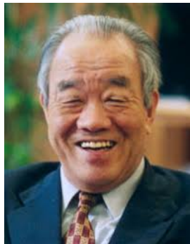
河合 隼雄 1928年 - 2007年